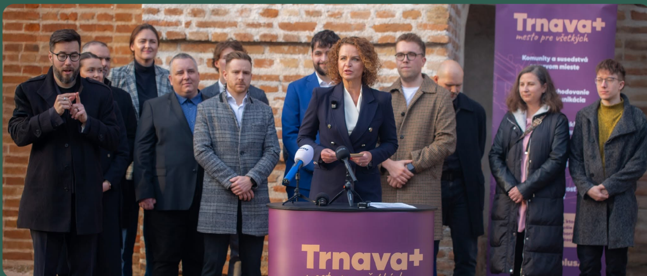
Tím Trnava+ — spoločne pre lepšiu Trnavu.

Vy priamo určujete, kam pôjde štartovací komunitný rozpočet vašej mestskej časti.